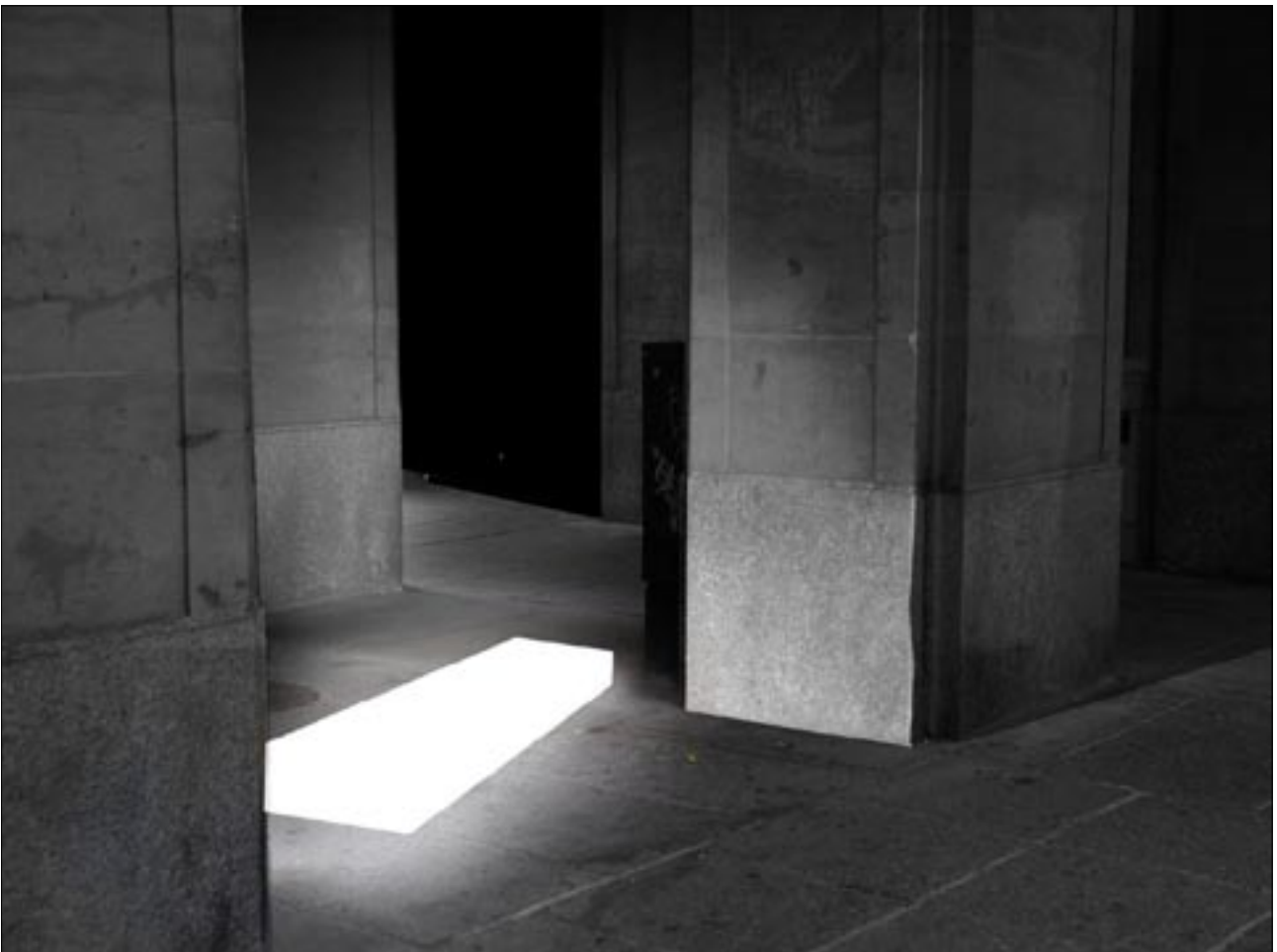
Fotomontage, Leuchtkörper im Bereich Wilsdruffer Straße, Durchgang zur Weißen Gasse

Dieser 13. Februar war ein Faschingsdienstag. Kurz vor der Bombardierung beendete Probst Beier in der katholischen Hofkirche das 40-stündige Gebet und bot sich und die Gemeinde als Opfer, um dem Wahnsinn des Krieges ein Ende zu setzen. Probst Beier und die Mitglieder der Gemeinde starben wenige Stunden später in der Bombennacht.