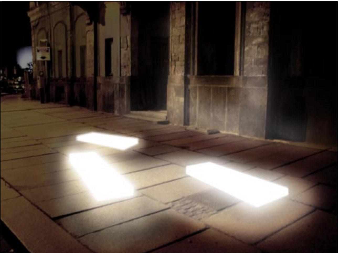
Fotomontage, Leuchtkörper im Bereich Taschenbergpalais, Blick in Richtung Synagoge