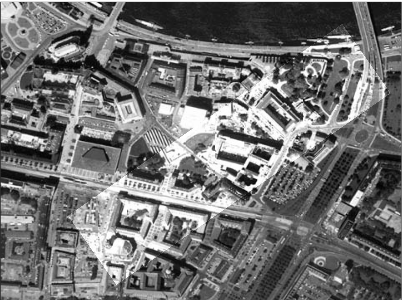
Luftbild mit Markierung des Bereiches zwischen Synagoge und Altmarkt - hier sollen die Leuchtkörper verteilt werden

Sie bilden damit eine Spur vom Standort der alten und neuen Synagoge zum Altmarkt. Die Körper sollen am 13. Februar um 22:00 Uhr aufleuchten und nach 40 Stunden am 15. Februar um 14:00 Uhr erlöschen.